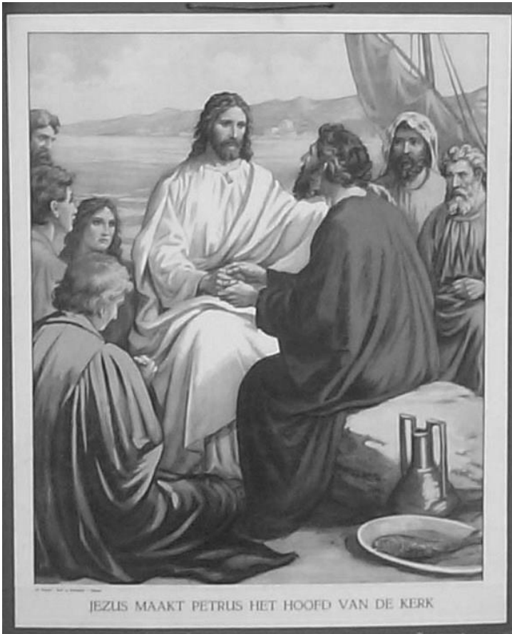
JEZUS MAAKT PETRUS HET HOOFD VAN DE KERK