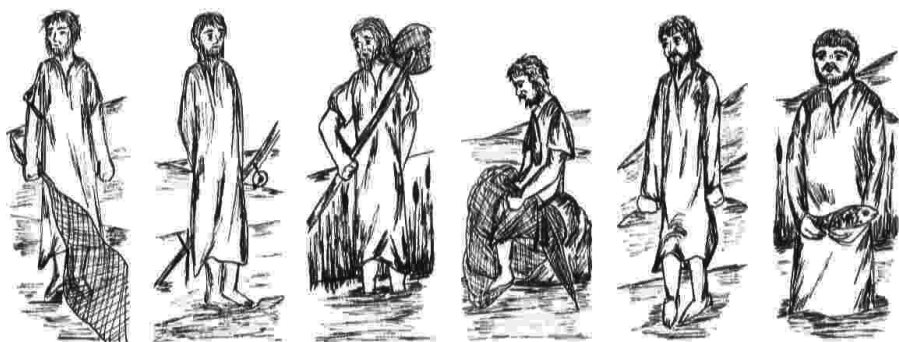
Petrus. Jakobus. Johannes. Andreas. Filippus. Bartolomeüs